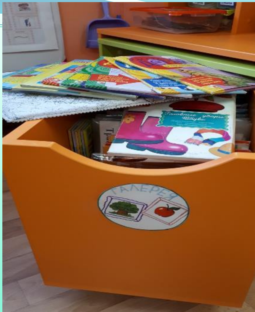
Модуль «Предметные и сюжетные картинки» по темам «Птицы», «Звери», «Морские обитатели», «Обитатели леса», «Космос», «Звёзды» и т.д.