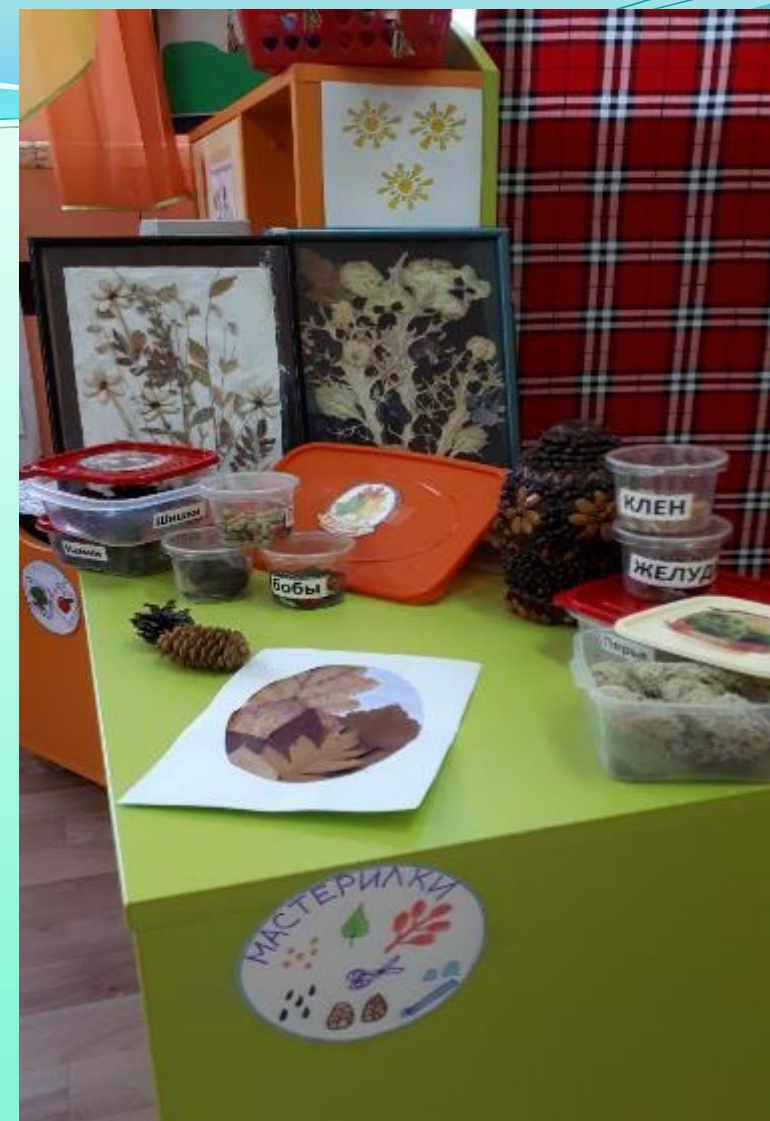
Модуль «Природный и бросовый материал»