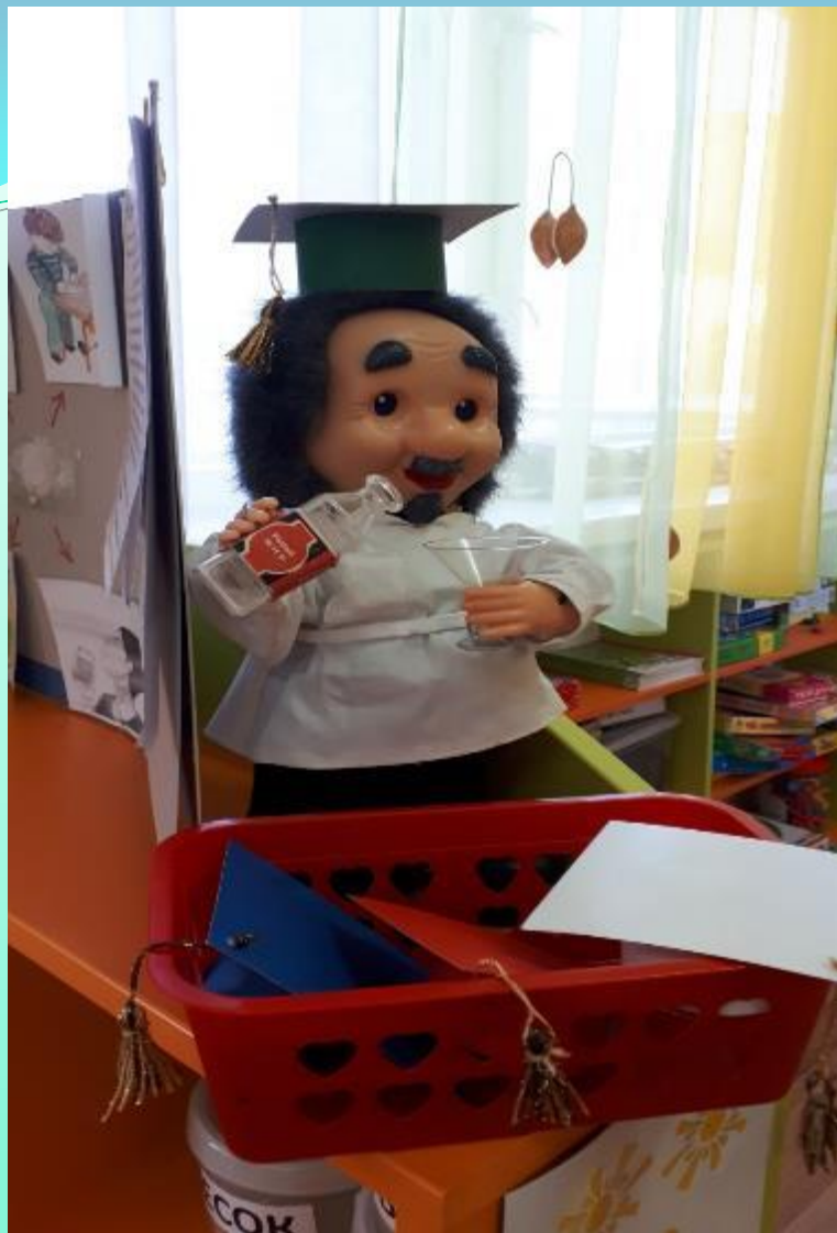
Хранитель Центра «Хочу всё знать» профессор Почемушкин и ящик вопросов.