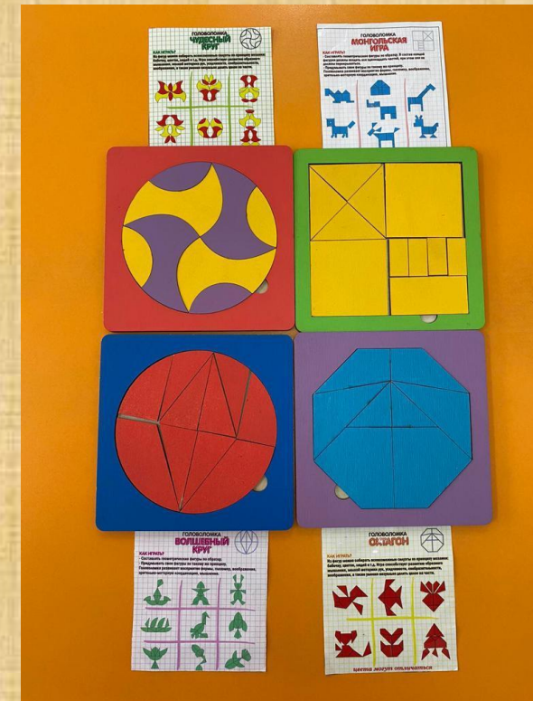
Монгольская игра, Колумбово яйцо, Вьетнамская игра, Волшебный круг).