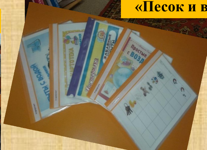
Альбомы для фиксации результатов