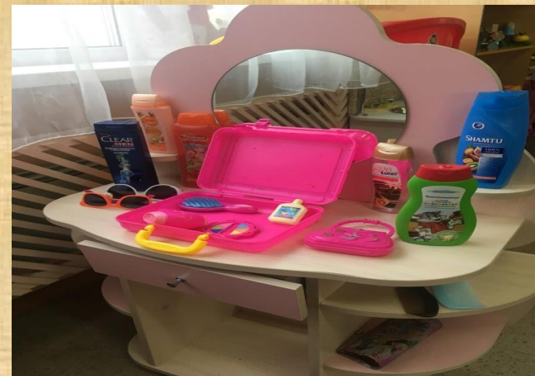
Модуль « Салон красоты »