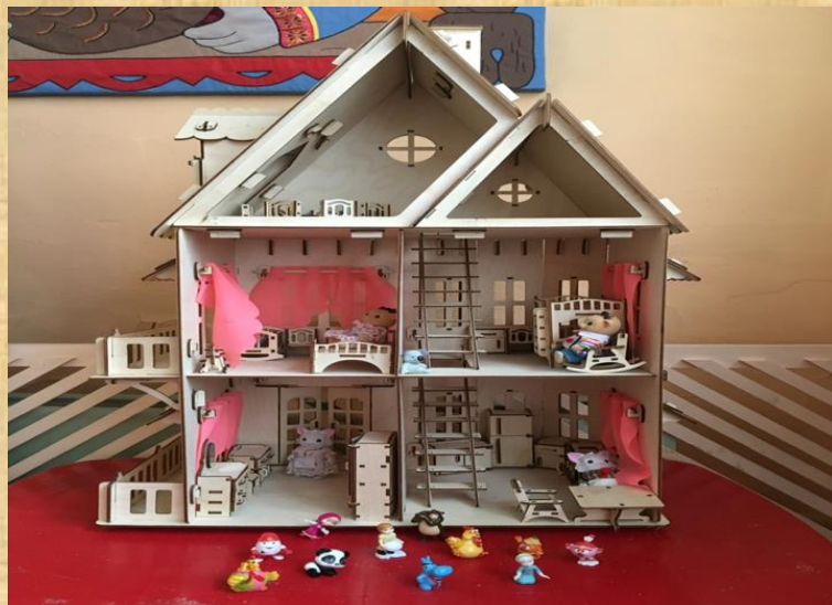
Модуль « Кукольный дом »