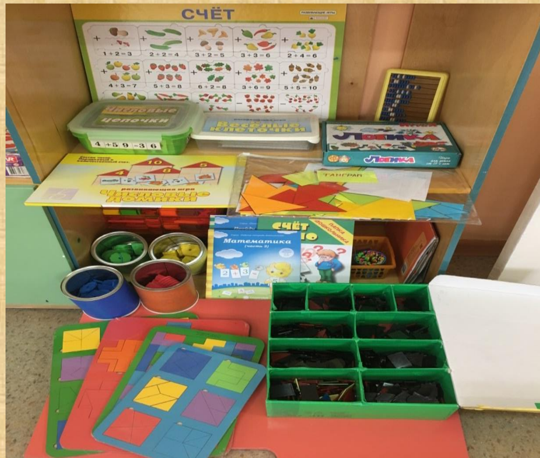
Набор цифр и геометрических фигур Шашки, ребусы, ассоциации. Математические развивающие, логические игры (рамки-вкладыши Танграм.