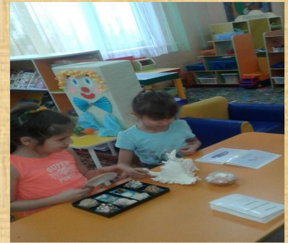
Модуль «Смотрим, изучаем, наблюдаем»