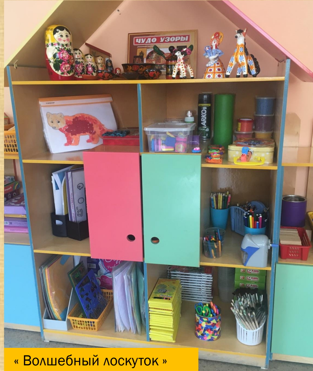
« Волшебный лоскуток »