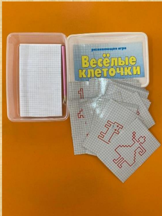
Игры и пособия по занимательной математике