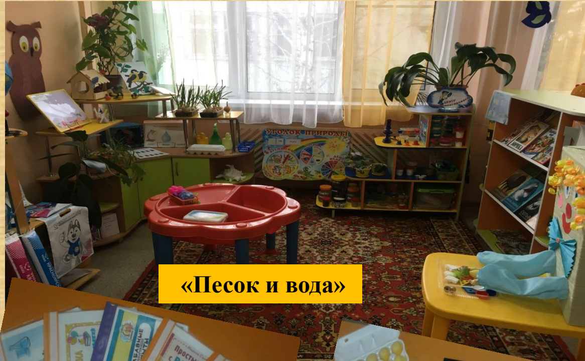
«Песок и вода»