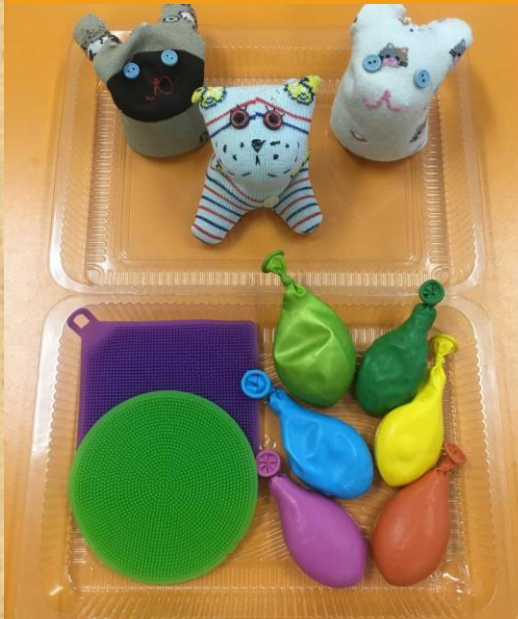
Игрушки – мнушки