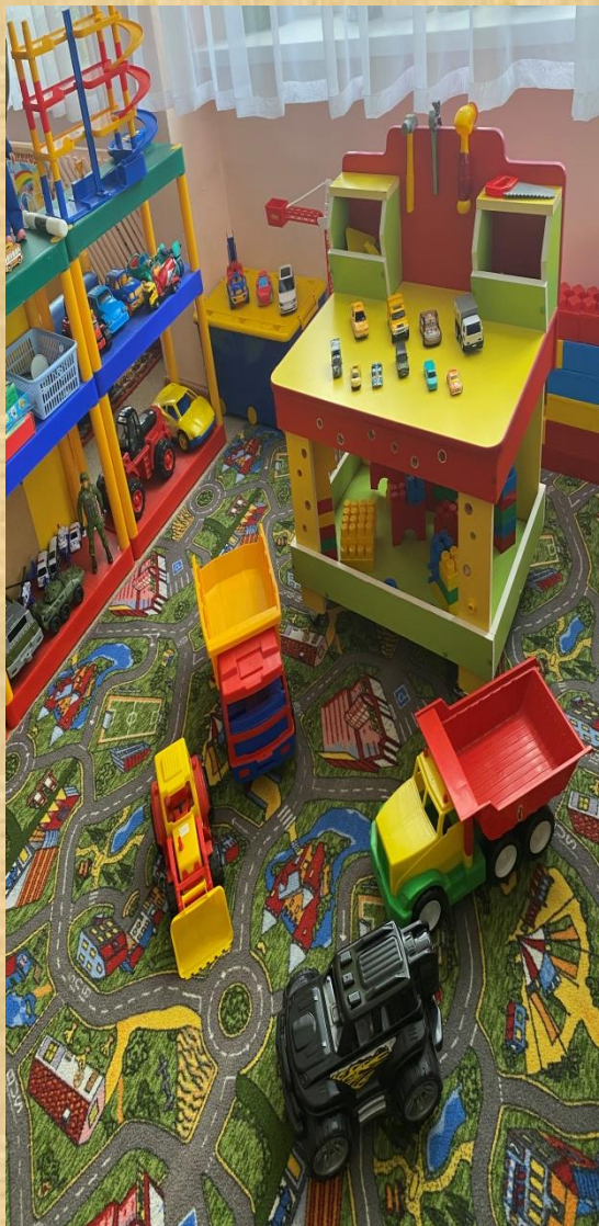
Модуль « Правила дорожного движения »